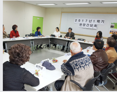
3월 24일 (금) 교육문화 1학기 반장 간담회