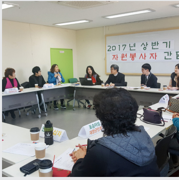
3월 3일 (금) 자원봉사자 간담회