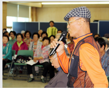
5월 25일(목) 제 4회 소통의 장 "서부복지 타운 건립에 대한 우리의 의견"