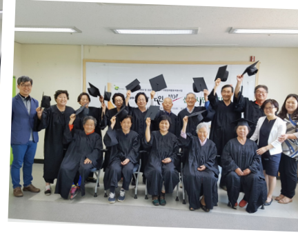
▲ 인문학 기본교육 수료식