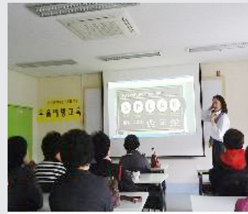
4월 6일 (목) 행복한 노후를 위한 우울예방교육