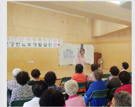
6월 8일(목) 이동복지관 사업 "건강한 노후생활 열린 건강강좌"