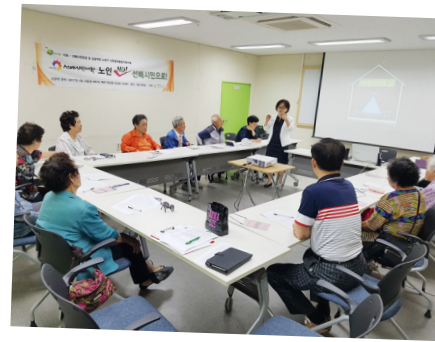
▲ 선배시민3기 인문학 기본교육