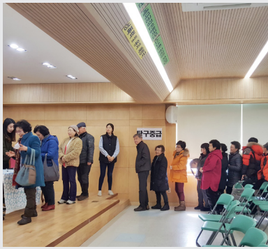
2월 28일 (화) 교육문화 1학기 참여자 초청