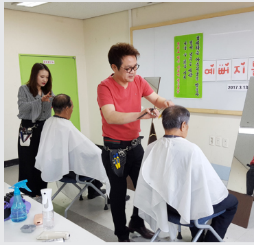
1월 ~ 6월 경기도미용사회적 협동조합 미용봉사 서비스