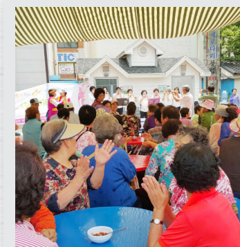
6월 26일(월) 삼성전자와 함께하는 소망나눔 두드림 2차 공연