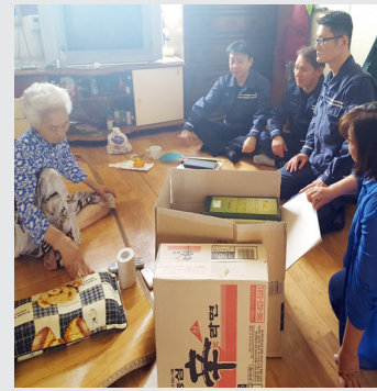
5월 30일(화) 해군2함대 수리창 전기공장 생필품 전달