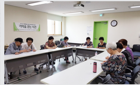
6월 14일(수) ~ 8월 2일(수) 주1회 집단상담 "기억을 걷는 시간"