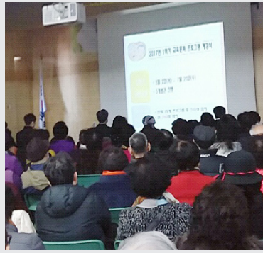
2월 8일 (수) 교육문화 1학기 사업 설명회