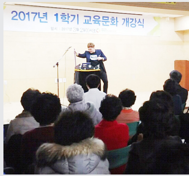
3월 2일 (목) 교육문화 개강식