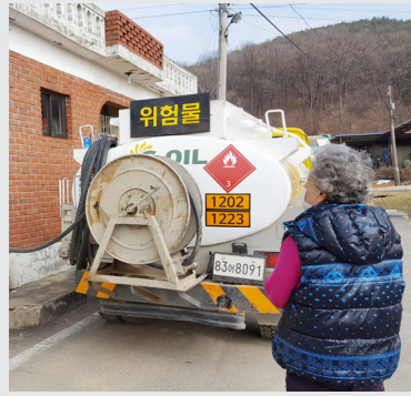
2월 16일 (목) 한국노인종합복지관협회 난방유 지원