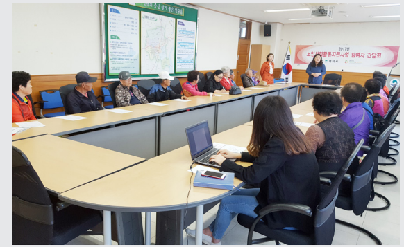
4월 14일(금) ~ 28일(금) 노인사회활동지원사업 참여자 간담회