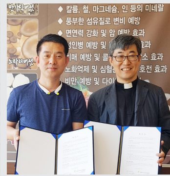
5월 19일(금) 소리버섯나라 업무협약식