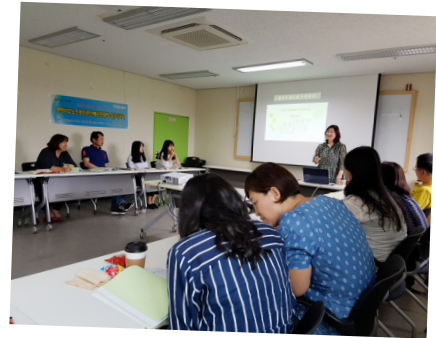
▲ 선배시민대학 실무자교육