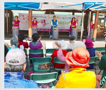
4월 12일 (수) 삼성전자와 함께하는 소망나눔 두드림 1차 공연