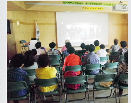
6월 15일(목) 시니어 영화관