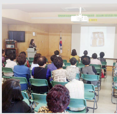
5월 18일(목) 자원봉사자 역량강화 교육 (인권 교육)