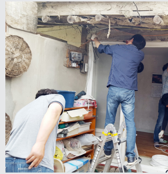
5월 23일(화) 한국석유공사평택지사와 함께하는 전기 점검 및 수리지원