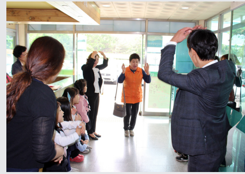
5월 8일(월) 어버이날 맞이 "사랑합니다. 행복하세요"