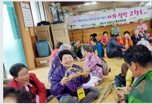
4월 17일 (월) 봄 나눔이 "나의 살던 고향은"