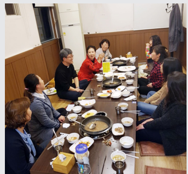
3월 23일 (목) 교육문화 1학기 강사 간담회