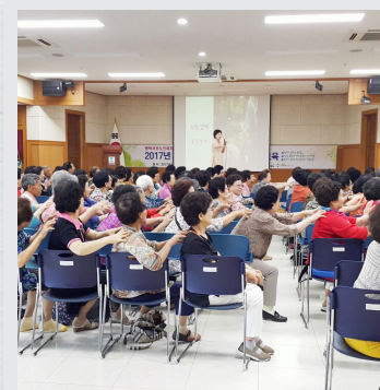
6월 15일(목) 노인사회활동지원사업 참여자 활동교육