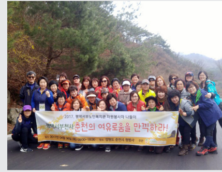
4월 6일 (목) 자원봉사자 나눔이 "평택서부천사 춘천의 여유로움을 만끽하라!"