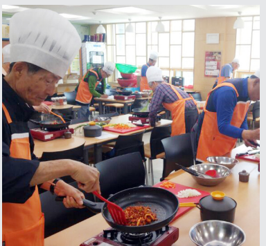
3월 ~ 6월 청춘밥상 1기 건강한 가정식 요리프로그램