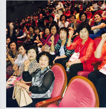
6월 2일(금) 문화예술교육지원사업 실버무용 현장학습