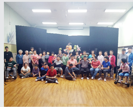
5월 26일(금) 소공자 공연활동 - 팽성장애인주간보호센터