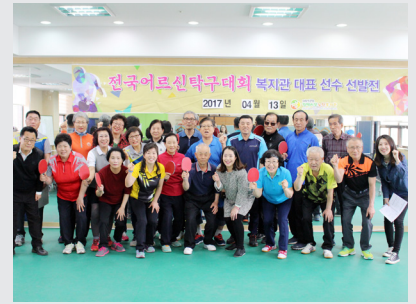
4월 13일 (목) 내부 탁구대회