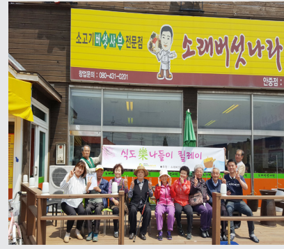
5월 16일(화) 소리버섯나라와 함께하는 "식도락 나들이"